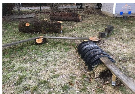
Material som utmanar barnens motoriska förmågor

lärande och variationen i lekredskap och material kan bidra till att utmana barnens olika förmågor. Rektorn berättade att förskolan nyttjar gården i stor utsträckning och därför strävar efter att erbjuda material som går att koppla till läroplanens alla målområden.