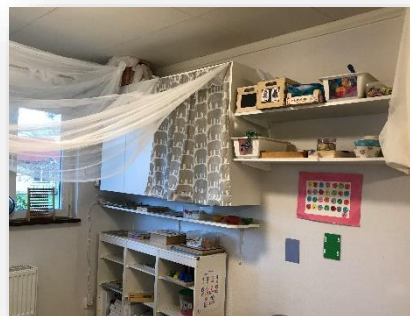
Material som är högt placerat

Pedagogerna berättade att en viss del av materialet plockas