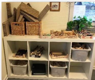
Bygg- och konstruktionsmaterial av varierande slag

Den pedagogiska miljön inomhus är inspirerande, stimulerande, tillgänglig, utmanande och varierande och uppmuntrar till lek