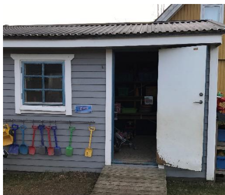
Barnen kan självständigt hämta material

Det finns stafflier i olika höjd och ett skåp på gården ska under våren 2020 fyllas på med en variation av material för estetiska uttryckssätt. På gården finns ett förråd för material och lekredskap. Vid observationerna stod förrådet öppet och barnen hade möjligheter att självständigt hämta det som de ville använda i sin lek. En viss del av det flyttbara materialet signalerar bestämda användningsområden, men det finns också föränderligt och formbart material som kan bidra till att stimulera