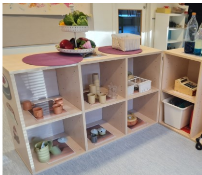
En stor del av materialet signalerar bestämda användningsområden

Förskolans fyra avdelningar har tillgång till egen entré och hall med skötrum och toalett i anslutning. Samtliga avdelningar har tillgång till flera rum för lek och lärande. Några rum används enbart för barnens vila. Det finns ett rörelserum och ett skolbibliotek som alla på förskolan har tillgång till. Avdelningarna för äldre respektive yngre barn ligger i anslutning till varandra. Detta möjliggör samarbete för pedagogerna.