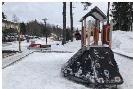
Det finns flera fasta lekinstallationer på gården

Förskolans har två gårdar. På den stora gården finns tillgång till fasta lekinstallationer såsom lekhus, klätterställning, sandlåda och en balansgång.